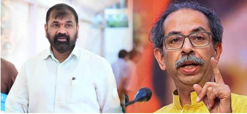
महाईन्यूज । मुंबई