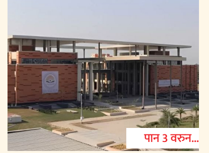
२८ एकरात होणार 'आयआयएम'