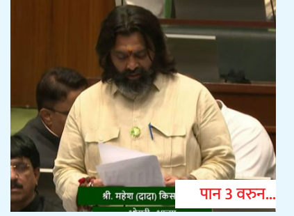
पुणे-नाशिक महामार्गाला निधीचा 'ऑक्सिजन' द्या!