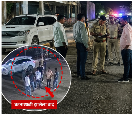
घटनास्थळी झालेला वाद