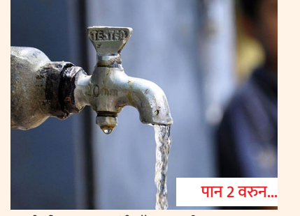
पाणीपट्टीचा वाद मुख्यमंत्री 'वॉर रूम' मध्ये!