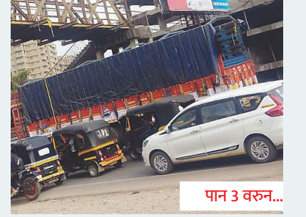
पुणे-नाशिक महामार्गावरील कोडी कायम