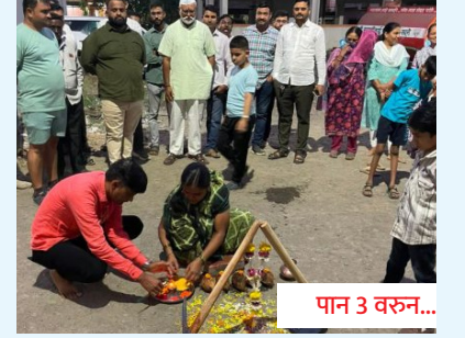
पान 3 वरून...

चिंचवड यात्रेत 'मेड इन पाकिस्तान' चादरीची विक्री?