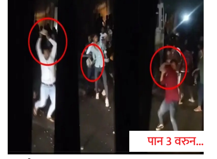
दगडफेक महागात; ३६ जण जाळ्यात