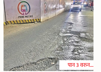
निगडी मेट्रोसाठी ५० कोटींचा निधी अडकला