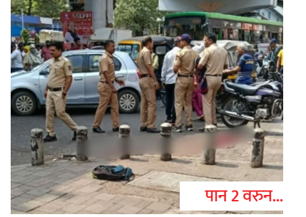
पुण्यात पुन्हा टोळीयुद्धाचा भडका!