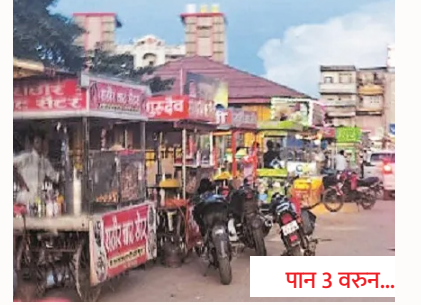
मोशी-चिखलीत दूषित खाद्यपदार्थाचा बाजार तेजीत