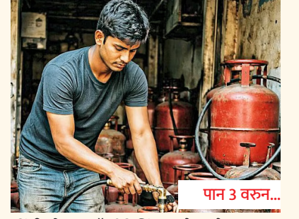
पान 3 वरून...