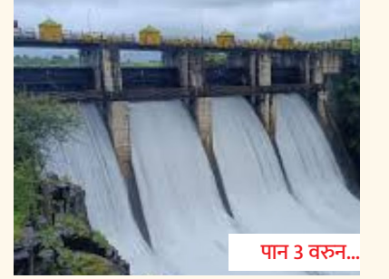
भामा-आसखेड जलप्रकल्पात विलंब