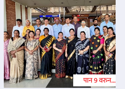
पिंपरी-चिंचवडमधील नारीशक्तीचा मुंबईत 'आक्रोश'