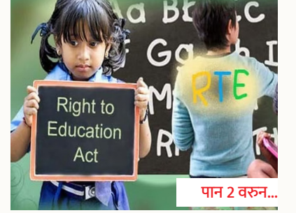
आरटीई प्रवेश प्रक्रियेत गोंधळ