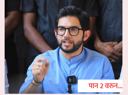
फक्त कोंक्रीट ओतणे म्हणजे विकास नाही!

WWW.MAHAENEWS.COM सोमवार, दि. 06 एप्रिल 2026 पुणे, पिंपरी-चिंचवड आवृत्ती MAHAENEWS.COM लढाई सत्याची... लोकशाहीच्या हक्काची!