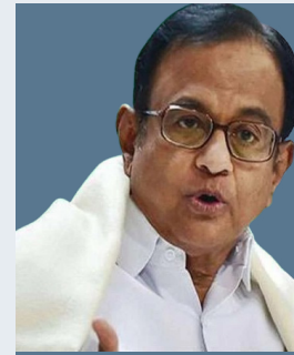
पी. चिदंबरम् (भाजप द्वेषाकडून भारत द्वेषाकडे)

कुटुंबीयांवर 'लुटारूंची टोळी' असा उल्लेख केल्यामुळे अजितदादा पवार चांगलेच संतापले आहेत. ते म्हणाले, की मंगेशकर कुटुंबाचे योगदान केवळ भारतातच नव्हे, तर जगाला माहीत आहे. त्यांनी वडेद्वीवार यांच्या वक्तव्याचा निषेध केला आणि मंगेशकर कुटुंबीयांनी संगीत आणि कलाक्षेत्रात केलेल्या अतुलनीय कार्याचा गौरव केला. अजित पवारांनी थेट प्रतिक्रिया देत वरील आरोपांना निराधार ठरवले आहे.