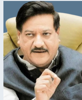
पृथ्वीराज चव्हाण (मूर्खपणाचे उद्गार)