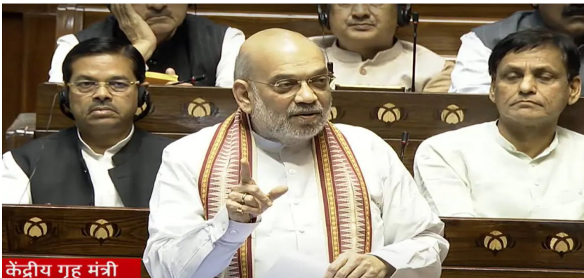
केंद्रीय गृह मंत्री

वडणगे गावातील एक ग्रामस्थ एबीपी माझाला म्हणाले, “या