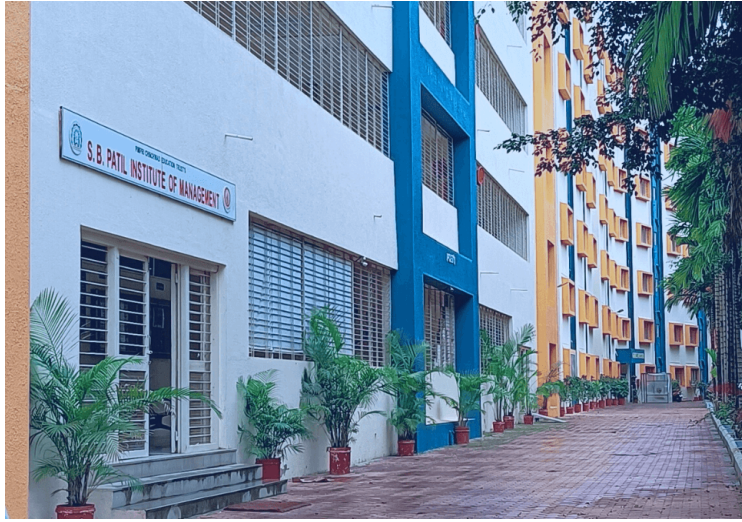
शनिवारी (दि. १ मार्च) मान्यवरांच्या उपस्थितीमध्ये बक्षीस वितरण समारंभ होणार आहे. युवोत्सव