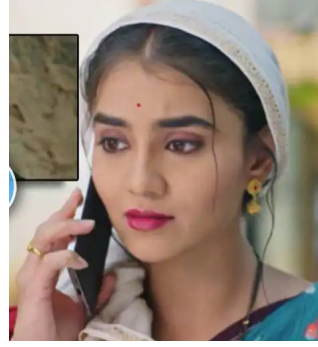
शकतात...याची त्याला पूर्ण खात्री असते.

सध्या मालिकेत सूर्या आणि तुळजामध्ये वाद निर्माण झाल्याचा सीक्वेन्स चालू आहे. मालिकेत जालिंदरच्या घरातील पार्टीत गोंधळ झाल्यानंतर, सूर्या त्याच्या बहिणींना घरी घेऊन येतो. दुसऱ्या दिवशी, त्याच्या चारही बहिणी त्याला त्याची चूक लक्षात आणून देतात. आता सूर्या दादा तुळजाची मनधरणी करण्याचा प्रयत्न करत आहे. अशातच, जगताप कुटुंबीयांच्या घरी धनूला एक स्थळ पाहायला येतं. यावेळी सूर्या मोठ्या काळजीत पडतो कारण, तुळजाशिवाय पाहुणे लग्नाचा प्रस्ताव नाकारू