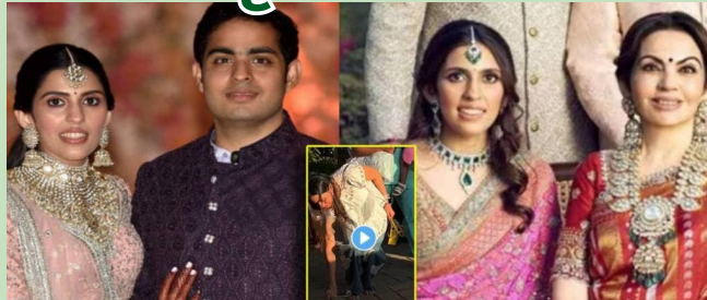
आपल्या मुलांना वेदा आणि पृथ्वीला घेऊन पोहोचली होती. या पार्टीतून बाहेर

व्हिडीओ सोशल मीडियावर खूप व्हायरल झाले आहेत. त्यानंतर आता मुकेश अंबानी आणि नीता अंबानी यांच्या थोरल्या सून्याच्या एका व्हिडीओने सगळ्यांचं लक्ष वेधून घेतलं आहे. हा व्हिडीओ पाहून अंबानींची थोरली सून श्लोका मेहताचं कौतुक केलं जात आहे. करीना कपूर-खान आणि सैफ अली खानचा मुलगा जेहची वाढदिवसाची पार्टी नुकतीच आयोजित करण्यात आली होती. या पार्टीला श्लोका