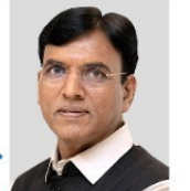
मा.श्री. मनसुख मांडविया टेलंगुड, युवा व्यवहार आणि क्रिडा मंत्री