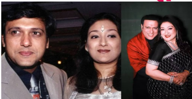
त्यांच्या भेटीबद्दल खुलासा केला