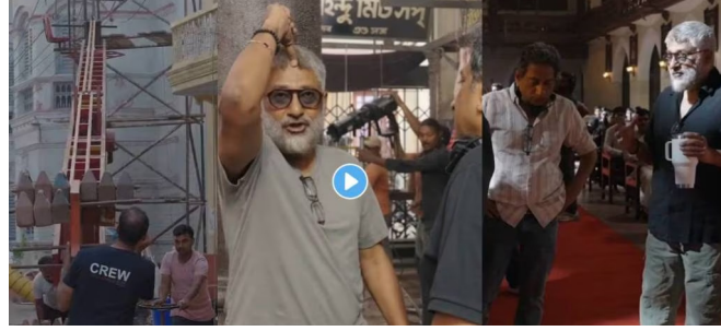
दिसतात. विवेक यांनी पुढे लिहिले, "द दिल्ली फाइल्स' हा फक्त एक

नरसंहाराच्या आजवर न सांगितल्या गेलेल्या सत्याला समोर आणण्यासाठी आमची टीम दिवस-रात्र मेहनत घेत असून समर्पणाने काम करत आहे." व्हिडीओत चित्रपटाच्या सेटवरील गंभीर वातावरण पाहायला मिळते. दिग्दर्शक विवेक अग्निहोत्री प्रचंड समर्पणाने टीमबरोबर काम करताना दिसतात. चित्रपटातील अभिनेते आणि टीम आपापल्या भूमिका निभावताना आणि चित्रपटाला वास्तवात उतरवण्यासाठी मेहनत करताना