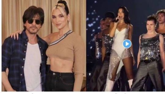
सरप्राइज दिलं. या लाइव्ह कॉन्सर्टमध्ये दुआ लिपाने शाहरुखचं 'वो लडकी जो'

अंबानीची धाकटी सून राधिका अंबानी, ईशा अंबानी पाहायला मिळाली. दुआ लिपाच्या लाइव्ह कॉन्सर्टमधील अनेक व्हिडीओ सोशल मीडियावर व्हायरल झाले आहेत. मुंबईत झालेल्या लाइव्ह कॉन्सर्टमध्ये गायिका दुआ लिपाने शाहरुख खानच्या चाहत्यांना एक जबरदस्त