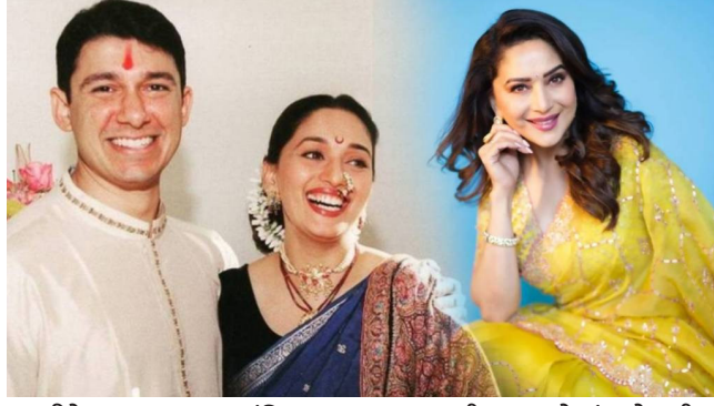
माधुरीने याबद्दल 'गलाटा इंडिया'ला दिलेल्या

हैं', 'साजन' अशा एकापेक्षा एक सुपरहिट चित्रपटांमध्ये ती झळकली. दमदार अभिनयासाठी फिल्मफेअर अवॉर्ड्स मिळवले. मात्र, १९९९ मध्ये करिअरच्या शिखरावर असताना माधुरीने लग्नबंधनात अडकण्याचा निर्णय घेतला. अभिनेत्रीने अचानक अमेरिकेला गेल्याने तिचे लाखो चाहते नाराज झाले होते. यानंतर देखील माधुरीने काही चित्रपटांमध्ये भूमिका साकारल्या. पण, हळुहळू तिने चित्रपटसृष्टीपासून दूर राहून कुटुंबीयांवर लक्ष केंद्रीत केलं.