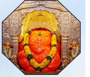
आठवा गणपती - रांजणगांवचा श्री महागणपती

स्वस्ति श्रीगणनायकं गजमुखं मोरेश्वरं सिद्धिदम् ॥ १ ॥ बल्लाळं मुरुडे विनायकमहं चिन्तामणिं थेवरे ॥ २ ॥ लेण्याद्री गिरिजात्मजं सुवरदं विघ्नेश्वरं ओझरे ॥ ३ ॥ ग्रामे रांजणनामके गणपतिं कुर्यात् सदा मंगलम् ॥ ४ ॥