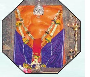
सहावा गणपती - लेण्याद्रीचा श्री गिरिजात्मक