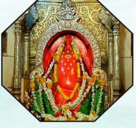
पहिला गणपती- मोरगांवचा श्री मयुरेश्वर