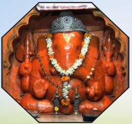
चौथा गणपती - महाडचा श्री वरदविनायक

अष्टविनायक हा शब्द 'अष्ट' आणि 'विनायक' या दोन शब्दांच्या संयोगातून तयार झाला आहे. अष्ट म्हणजे आठ आणि विनायक म्हणजे आपले लाडके दैवत गणपती. कोणतेही शुभ कार्य सुरू करण्यापूर्वी प्रथम गणपतीची पूजा केली जाते. कारण गणपतीबाप्पा चौदा विद्या, चौसष्ट कलांचा अधिपती आहे आणि सर्व विघ्ने दूर करणारा गणपतीबाप्पा आपल्या मार्गातील सर्व अडथळे दूर करतो आणि समृद्धी देतो. ही मंदिरे प्रेक्षणीय स्थळांपैकी आहेत. या आठही मंदिरांची स्थापत्य रचना अतिशय उत्कृष्ट आणि मनाला आनंद देणारी आहे. वास्तविक पुण्याच्या जवळ विविध गावांत श्रीगणेशाची आठ मंदिरे आहेत, त्यांना अष्टविनायक म्हणतात. या मंदिरांना स्वयंभू मंदिरे असेही म्हणतात. स्वयंभू म्हणजे येथे भगवान श्रीगणेश स्वतः प्रकट झाले आहेत. म्हणजेच कोणीही त्यांची मूर्ती आणि मुद्दल पुराण यांसारख्या विविध उल्लेख आढळतो. ही मंदिरे त्यांना ऐतिहासिक महत्त्वही आहे. अष्टविनायक तीर्थयात्रा असेही मंदिराच्या संदर्भात असे गणेशाची ही आठ पवित्र पावली आणि जागृत