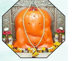
पाचवा गणपती - थेऊरचा श्री चिंतामणी

अष्टविनायक हा शब्द 'अष्ट' आणि 'विनायक' या दोन शब्दांच्या संयोगातून तयार झाला आहे. अष्ट म्हणजे आठ आणि विनायक म्हणजे आपले लाडके दैवत गणपती. कोणतेही शुभ कार्य सुरू करण्यापूर्वी प्रथम गणपतीची पूजा केली जाते. कारण गणपतीबाप्पा चौदा विद्या, चौसष्ट कलांचा अधिपती आहे आणि सर्व विघ्ने दूर करणारा गणपतीबाप्पा आपल्या मार्गातील सर्व अडथळे दूर करतो आणि समृद्धी देतो. ही मंदिरे प्रेक्षणीय स्थळांपैकी आहेत. या आठही मंदिरांची स्थापत्य रचना अतिशय उत्कृष्ट आणि मनाला आनंद देणारी आहे. वास्तविक पुण्याच्या जवळ विविध गावांत श्रीगणेशाची आठ मंदिरे आहेत, त्यांना अष्टविनायक म्हणतात. या मंदिरांना स्वयंभू मंदिरे असेही म्हणतात. स्वयंभू म्हणजे येथे भगवान श्रीगणेश स्वतः प्रकट झाले आहेत. म्हणजेच कोणीही त्यांची मूर्ती आणि मुद्दल पुराण यांसारख्या विविध उल्लेख आढळतो. ही मंदिरे त्यांना ऐतिहासिक महत्त्वही आहे. अष्टविनायक तीर्थयात्रा असेही मंदिराच्या संदर्भात असे गणेशाची ही आठ पवित्र पावली आणि जागृत