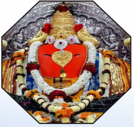
तिसरा गणपती - पालीचा श्री बल्लाळेश्वर