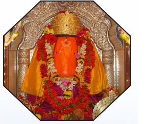
सातवा गणपती - ओझरचा श्री विघ्नेश्वर