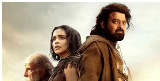
सातत्य राखले आहे. याचप्रकारे

महिन्यांनंतरही प्रेक्षकांचे मनोरंजन करण्यात तो यशस्वी ठरला आहे. पाचव्या शनिवारी या चित्रपटाची भारतातील एकूण कमाई ६२७.८५ कोटी रुपये झाली आहे. नाग अश्विन दिग्दर्शित ‘कल्की : २८९८ एडी’ या चित्रपटाने चित्रपटगृहात एक महिना पूर्ण केला असून कमाईच्या बाबतीत