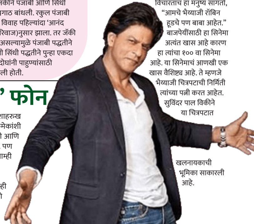
खलनायकाची भूमिका साकारली आहे.

विचारातच हा मनुष्य सांगतो, "आमचे भैय्याजी रॉबिन हूडचे पण बाबा आहेत." बाजपेयींसाठी हा सिनेमा अत्यंत खास आहे कारण हा त्यांचा १०० वा सिनेमा आहे. या सिनेमाचं आणखी एक खास वैशिष्ट्य आहे. ते म्हणजे भैय्याजी चित्रपटाची निर्मिती त्यांच्या पत्नी करत आहेत. सुविंदर पाल विकीने या चित्रपटात