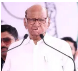
राष्ट्रवादी शरदचंद्र पवार पक्षाचे अध्यक्ष शरद पवार यांनी विधानसभा