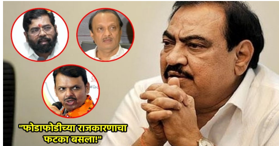
"फोडाफोडीच्या राजकारणाचा फटका बसला!"

भाजपाप्रणीत महायुतीला मोठा फटका बसण्याचा अंदाज वर्तवण्यात आला आहे. त्यावरून राज्यात दावे-प्रतिदावे सुरु झाले आहेत. भारतीय जनता पक्षाचे नेते चंद्रकांत पाटील, यांनी महाराष्ट्रासंदर्भात एक्झिट पोलचे हे आकडे चुकणार असून ४ जूनला महायुतीलाच जास्त जागा मिळणार असल्याचा दावा केला आहे. पण त्याचवेळी निवडणुकांपूर्वी भाजपामध्ये प्रवेशाचा मानस उघडपणे बोलून दाखवणारे एकनाथ खडसे यांनी भाजपालाच कानपिचक्या दिल्या आहेत. भाजपाला राज्यात फोडाफोडीच्या राजकारणाचा फटका बसल्याचं विधान एकनाथ खडसेंनी केलं आहे. भाजपाला फोडाफोडीच्या राजकारणाचा फटका बसला