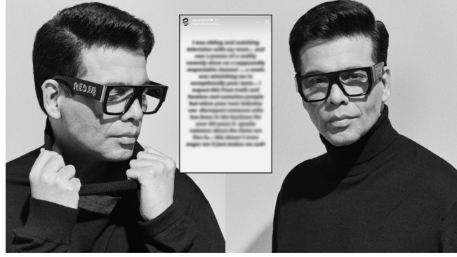
मला याचं खूप वाईट वाटलं. दरम्यान, करणच्या कामाबद्दल सांगायाचं झालं तर, करण जोहरचा 'योद्धा' चित्रपट १५ मार्चला प्रदर्शित

त्याच्या सोशल मीडियावर स्टोरी शेअर करत लिहिलं, "मी माझ्या आईबरोबर बसून टिव्ही बघत होतो आणि एका प्रतिष्ठित चॅनलवर मी एका नामांकित रिऑलिटी कॉमेडी शोचा प्रोमो पाहिला. त्यात एक कॉमेडी स्किट होतं ज्यात ते माझी नक्कल करत होते. त्यांनी अत्यंत वाईट नक्कल केली. ट्रोल्स आणि निनावी लोकांकडून मी अशी अपेक्षा करू शकतो परंतु जेव्हा तुमचीच इंडस्ट्री अशा व्यक्तीचा अनादर करते जो व्यक्ती २५ वर्षांपासून या इंडस्ट्रीत आहे, तेव्हा काळानुसार सगळ्या गोष्टी आपोआप उघड होतात. यामुळे या गोष्टीचा मला राग नाही आला पण