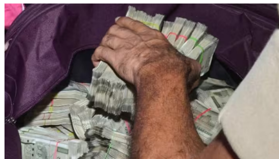
गाडी आढळून आली. पोलीसांनी अधिक तपास करून गाडीतून १३ लाख ९० हजाराच्या ५०० रुपयांच्या नोटा आणि ३० लाख रुपये किंमतीचे

आचारसंहिता काळात ५० हजार रुपयांपेक्षा जास्त रक्कम जवळ बाळगता येत नाही. भरारी पथकांतर्फे विविध ठिकाणी जिल्ह्यात येणाऱ्या वाहनांची तपासणी करण्यात येत आहे. भोसरी एमआयडीसी पोलीसांनी भोसरी एममआयडीसी पोलीस स्टेशन जवळील सी सर्कल जवळ ८ एप्रिल रोजी मध्यरात्री फॅन्सी नंबर प्लेट असलेली आणि संशयास्पदरितेने फिरणारी काळ्या रंगाची फॉरच्यूनर