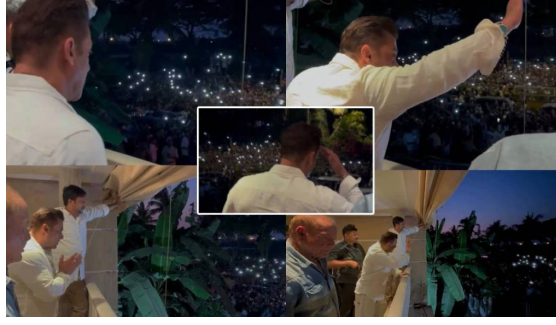
मुबारक", असं कॅप्शन लिहित सलमान खानच्या इन्स्टाग्रामवर नुकताच व्हिडीओ

झाला. तरी देखील चाहते भाईजानची एक झलक पाहण्यासाठी घराबाहेर थांबले होते. अखेर सलमान खानची झलक चाहत्यांना झाली आहे. याचे अनेक व्हिडीओ सध्या सोशल मीडियाच्या माध्यमातून समोर आले आहेत. शिवाय सलमानच्या सोशल मीडिया अकाउंटवर व्हिडीओ शेअर करण्यात आला आहे. "ईद