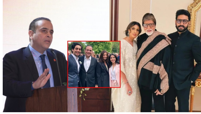
‘वाढदिवसाच्या शुभेच्छा डॅड, आय लव्ह यू, असं कॅप्शन नव्याने फोटोला दिलं होतं. दरम्यान, निखिल नंदा हे बच्चन कुटुंबातील

पण त्यांच्या वाढदिवसानिमित्त श्वेता किंवा बच्चन कुटुंबातील कुणीही सोशल मीडियावर पोस्ट केल्याचं दिसून आलं नाही. ऐरवी छोट्या छोट्या क्षणांचेही फोटो स्टोरीला पोस्ट करणाऱ्या श्वेतानेही पतीच्या वाढदिवसाची मात्र पोस्ट टाकली नाही. अमिताभ बच्चन व अभिषेकही कुटुंबातील प्रत्येकाच्या वाढदिवसानिमित्त पोस्ट करत असतात, पण निखिल यांच्या वाढदिवसानिमित्त नव्या नवेली वगळता कोणीच सोशल मीडियावर पोस्ट केली नाही. फक्त नव्याने बाबांबरोबरचा तिचा बालपणीचा फोटो स्टोरीवर शेअर करत त्यांना शुभेच्छा दिल्या.