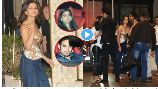
३१ वर्षीय आलियाच्या कामाबद्दल बोलायचं झाल्यास तिच्या आगामी 'जिगरा' चित्रपटाचं शूटिंग पूर्ण झालं आहे. २०२३ मध्ये आलेला