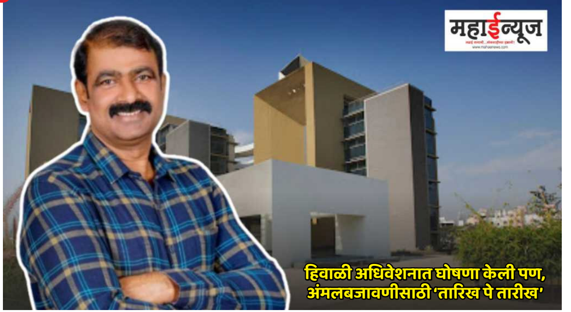
हिवाळी अधिवेशनात घोषणा केली पण, अंमलबजावणीसाठी 'तारिख पे तारीख'

पिंपरी-चिंचवड नवनगर विकास प्राधिकरणाच्या विकासासाठी प्राधिकरणाने सन १९७२ पासून सन १९८३ पर्यंत शेतकऱ्यांच्या जमिनी संपादित केलेल्या आहेत. १९८४ नंतर दुसरा टप्पा संपादित झाला. १९८४ नंतरच्या बाधित शेतकऱ्यांना मोबादला मिळाला. पण, १९७२ ते १९८३ दरम्यान जमिनी संपादित झालेल्या १०६ बाधित शेतकऱ्यांना कुठलाही मोबादला मिळालेला