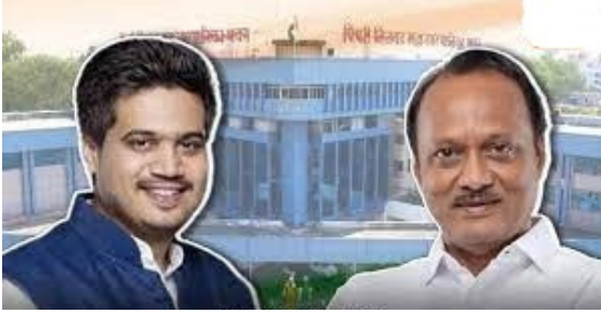
उपमुख्यमंत्री अजित पवार यांचा शहरात मोठा जनसंपर्क आणि दरास आहे. राष्ट्रवादीच्या फुटीनंतर सर्वच माजी नगरसेवक, आमदार आणि पदाधिकारी