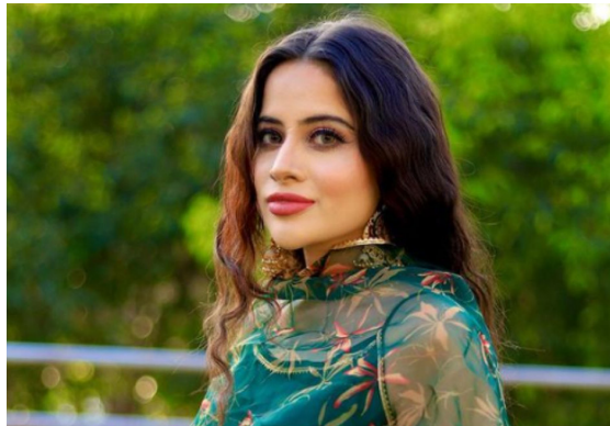
निर्णय घेतला होता. तिच्या

कारण सांगितलं आहे. उर्फीच्या व्हायरल झालेल्या व्हिडिओमध्ये ती वेटर बनून लोकांना प्रेमाने जेवण सर्व्हर करताना दिसतेय. याशिवाय ती लोकांसोबत आपुलकीने गप्पा मारतानाही दिसतेय. उर्फीचा वेटर बनल्याचा व्हिडिओ व्हायरल झाल्यापासून यावर अनेक प्रतिक्रिया आल्या. आज तिने इंस्टाग्रामवर ही खास गोष्ट उघड करताना सांगितलं की, तिने कॅन्सर पेशंट्स एड असोसिएशनसाठी निधी उभारण्यासाठी वेट्रेस होण्याचा