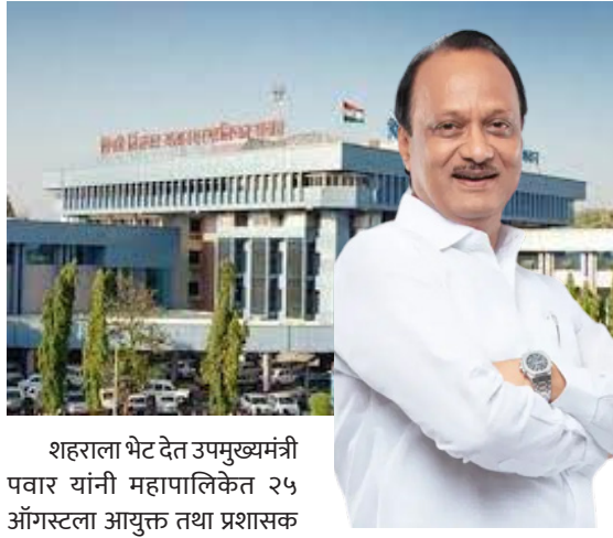
शहराला भेट देत उपमुख्यमंत्री पवार यांनी महापालिकेत २५ ऑगस्टला आयुक्त तथा प्रशासक

आल्याने राष्ट्रवादीचा उत्साह मावळला होता. पालिकेतील अनेक कामांत गैरव्यवहार झाल्याचा आरोप करीत राष्ट्रवादीने आंदोलन उभारले होते.