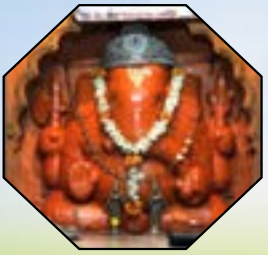
चौथा गणपती - महाडचा श्री वरदविनायक

अष्टविनायक हा शब्द 'अष्ट' आणि 'विनायक' या दोन शब्दांच्या संयोगातून तयार झाला आहे. अष्ट म्हणजे आठ आणि विनायक म्हणजे आपले लाडके दैवत गणपती. कोणतेही शुभ कार्य सुरु करण्यापूर्वी प्रथम गणपतीची पूजा केली जाते. कारण गणपतीबाप्पा चौदा विद्या, चौसष्ट कलांचा अधिपती आहे आणि सर्व विघ्ने दूर करणारा गणपतीबाप्पा आपल्या मार्गातील सर्व अडथळे दूर करतो आणि समृद्धी देतो. ही मंदिरे प्रेक्षणीय स्थळांपैकी आहेत. या आठही मंदिरांची स्थापत्य रचना अतिशय उत्कृष्ट आणि मनाला आनंद देणारी आहे. वास्तविक पुण्याच्या जवळ विविध गावांत श्रीगणेशाची आठ मंदिरे