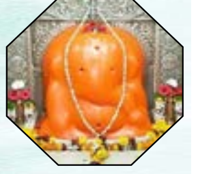
पाचवा गणपती - थेऊरचा श्री चिंतामणी

आहेत, त्यांना अष्टविनायक म्हणतात. या मंदिरांना स्वयंभू मंदिरे असेही म्हणतात. स्वयंभू म्हणजे येथे भगवान श्रीगणेश स्वतः प्रकट झाले आहेत. म्हणजेच कोणीही त्यांची मूर्ती बनवून बसवली नाही. गणेश आणि मुद्गल पुराण यांसारख्या विविध पुराणांमध्येही या मंदिरांचा उल्लेख आढळतो. ही मंदिरे अतिशय प्राचीन असून त्यांना ऐतिहासिक महत्त्वही आहे. या मंदिरांच्या यात्रेला अष्टविनायक तीर्थयात्रा असेही म्हणतात. अष्टविनायक मंदिरांच्या संदर्भात असे मानले जाते की तीर्थ गणेशाची ही आठ पवित्र मंदिरे स्वतःच उगम पावली आणि जागृत झाली.