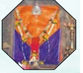
सहावा गणपती - लेण्याद्रीचा श्री गिरिजात्मक