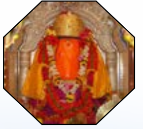
सातवा गणपती - ओझरचा श्री विघ्नेश्वर