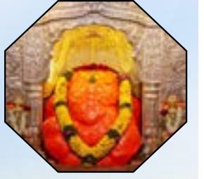
आठवा गणपती - रांजणगांवचा श्री महागणपती

स्वस्ति श्रीगणनायकं गजमुखं मोरेश्वरं सिद्धिदम् ॥१॥ बल्लाळं मुरुडे विनायकमहं चिन्तामणिं थेवरे ॥२॥ लेण्याद्रौ गिरिजात्मजं सुवरदं विघ्नेश्वरं ओझरे ॥३॥ ग्रामे रांजणनामके गणपतिं कुर्यात् सदा मंगलम् ॥४॥