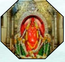
पहिला गणपती- मोरगांवचा श्री मयुरेश्वर