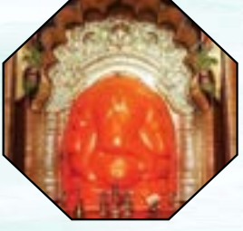
दुसरा गणपती - सिद्धटेकचा श्री सिद्धेश्वर