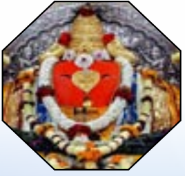
तिसरा गणपती - पालीचा श्री बल्लाळेश्वर