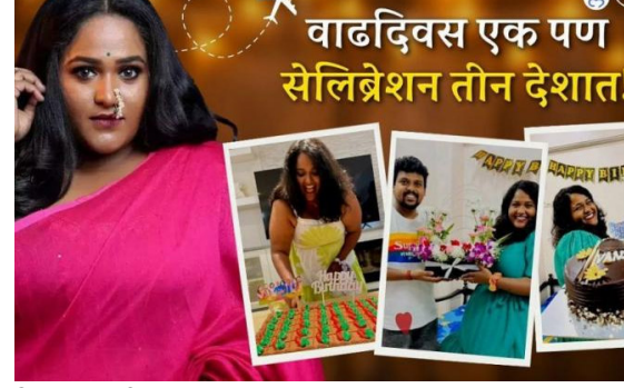
घेऊन आली, आणि माझ्या मित्रांनी या वाटेवर माझी सोबत केली.

माझा वाढदिवस साजरा झाला तोही ३ देशांमध्ये अमेरिका, कॅनडा आणि भारत... तोही माझ्या लाडक्या माणसांबरोबर! इतक्या जल्लोषात आणि उत्साहात, इतक्या वेगवेगळ्या गोष्टी बघत माझा वाढदिवस साजरा होईल असं खरंच वाटलं नव्हतं. प्रेक्षकांच्या प्रेमाची ताकद मला आज इथवर