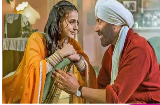
लिहिले की, 'आपल्या

दिसणार आहेत. चित्रपटाचे नवीन मोशन पोस्टर शेअर करताना निर्मात्यांनी लिहिले की, 'वडिलांच्या प्रेमाला मर्यादा नसते.' व्हिडिओमध्ये सनी आणि उत्कर्ष भारत-पाकिस्तान सीमेवर धावत असून चारही बाजूंनी त्यांच्यावर गोळ्या झाडल्या जात आहेत. हे पोस्टर शेअर करताना सनी देओलने