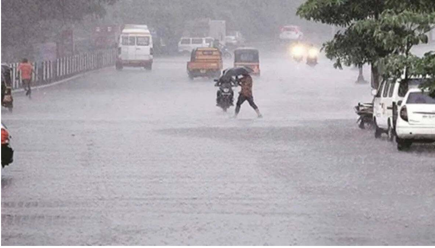
देशभरात पोहोचले. पूर्व आणि पश्चिम किनारपट्टी, दक्षिण भारत, ईशान्य भारतात जूनच्या शेवटच्या

मोसमी वाऱ्यात फारसा जोर नव्हता. पण, बिपरजॉय चक्रीवादळीमुळे मोसमी वारे वेगाने