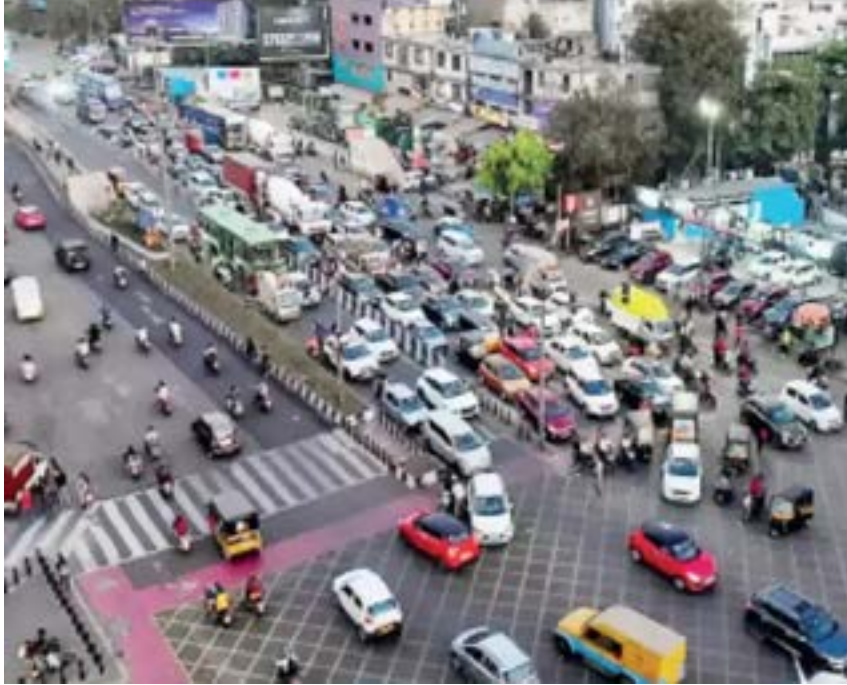
पुणे-नगर रस्तावरील वाहतूक कोंडीवर उपाय म्हणून

पुणे-नगर मार्गावरील वाहतूक कोंडीवर उपाय म्हणून आता नाशिक फाटा ते खेडपर्यंतच्या सुमारे ३० किलोमीटरच्या 'उन्नत मार्ग' (एलिव्हेटेड) महामार्गाच्या भूसंपादनाच्या कामास सुरुवात झाली आहे. मात्र, प्रत्यक्षात या कामासाठी येत्या ऑक्टोबरपासून सुरुवात होणार आहे. त्यामुळे भारतीय राष्ट्रीय महामार्ग प्राधिकरणाच्या (एनएचएआय) पुण्यातील महामार्गाच्या कामांना गती मिळणार आहे. या प्रकल्पासाठी राज्य सरकारचा नेमका किती वाटा असणार याबाबत सध्या चर्चा सुरु असल्याचे सांगण्यात आले आहे.