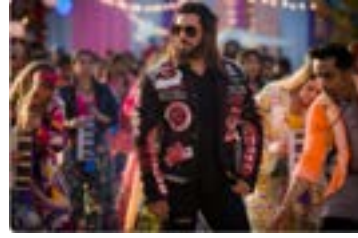
सलमान खानने त्याच्या ट्विटर अकाऊंटवरु 'किसी का भाई किसी

सलमान खानने शेअर केला 'किसी का भाई किसी की जान' मधील लूक