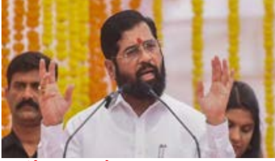
राज्यमंत्री रामदास आठवले या कार्यशाळेला उपस्थित राहणार आहेत.

राज्यासह देशातील अनुसूचित जाती घटकांसाठीच्या योजनांची प्रभावी अंमलबजावणी, जनजागृती, नियम आणि कायद्यांसह योजना तळागाळातील नागरिकांपर्यंत पाहोचवण्यासाठी पुण्यात विचारमंथन होणार आहे. त्यासाठी केंद्र शासनाच्या सामाजिक न्याय आणि विशेषाधिकार मंत्रालय, राज्याच्या सामाजिक न्याय विभागातर्फे राष्ट्रीय कार्यशाळा मंगळवारी (२८ फेब्रुवारी) होणार आहे. राज्याचे मुख्यमंत्री एकनाथ शिंदे, केंद्रीय सामाजिक न्याय विभागाचे मंत्री वीरेंद्र कुमार,