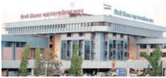
पिंपरी. महाईन्यूज । प्रतिनिधी।

» प्रशासनाची केवळ बघ्याची भूमिका: विद्यार्थी- पालकांच्या भावनांशी खेळ