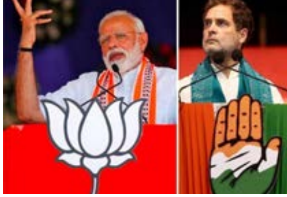
नरेंद्र मोदी गुजरातमध्ये 2002 साली सर्वाधिक 127 मुख्यमंत्री असताना भाजपने जागांवर विजय मिळवला होता.

गुजरातमध्ये सलग पाचव्यांदा सत्ता संपादित करण्यात भाजपला यश आले आहे. तर हिमाचलमध्ये मतदारांनी भाजपला झिडकारून काँग्रेसला साथ दिली आहे. देशभरातील पोटनिवडणुकांमध्ये मात्र भाजपला मोठा फटका बसल्याचे दिसत आहे.