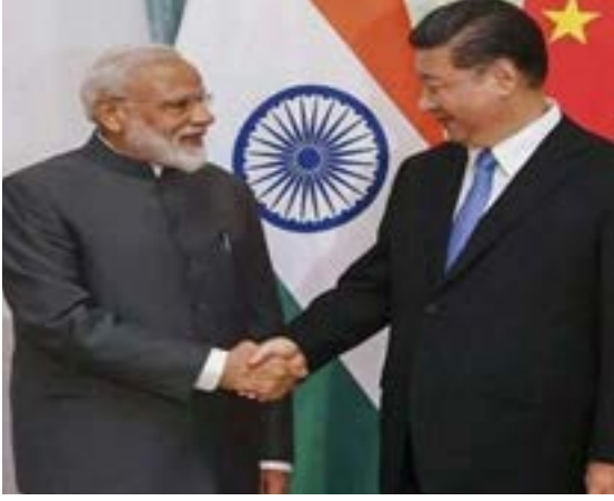
आंतरराष्ट्रीय सीमांचं उल्लंघन बाबतीत भारताशिवाय इतर होता कामा नये. विकासाच्या कोणताही दुसरा देश चीनसोबत

जगात भारताशिवाय दुसरा कोणताही देश नाही, जो चीनला टक्कर देऊ शकेल, असं कौतुक जर्मनीने केलं आहे. काही दिवसांपूर्वी अरुणाचल प्रदेश येथील प्रत्यक्ष नियंत्रण रेषेवर भारत आणि चीन सैनिकांमध्ये जोरदार झटापट झाली. या झटापटीत दोन्ही देशांचे सैनिक जखमी झाले होते. भारत-चीन हा चिंतेचा विषय आहे.