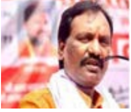
। पुणे। महाईन्यूज ।

मुंबई महापालिकेवर ताबा घेण्यासाठी निवडणूक तयारीच्या दृष्टीने केंद्रीय गृहमंत्री अमित शहा यांना मुंबईत यावे लागते, हाच