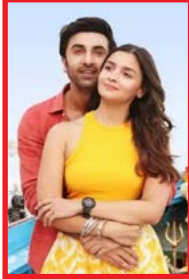
सीट्स जोडल्या गेल्या तर चित्रपटाने ७.६७ कोटी रुपयांची अॅडव्हान्स बुकिंग केले जाई.

आलिया भट्ट आणि रणबीर कपूरचा 'ब्रह्मास्त्र' हा बहुप्रतिक्षित चित्रपट येत्या शुक्रवारी प्रदर्शित होणार आहे. हा चित्रपट प्रदर्शित होण्याची सगळे प्रेक्षक आतुरतेने वाट पाहत आहेत. या चित्रपटासाठी जवळपास ३०० कोटी रुपये खर्च करण्यात आले आहेत. या चित्रपटाचे तीन भाग असणार आहेत. या चित्रपटाच्या ट्रेलरलाही तुफान प्रतिसाद मिळाला. मात्र लालसिंग चड्ढाप्रमाणे 'बॉयकॉट ब्रह्मास्त्र' हा ट्रेंड देखील काही दिवसांपासून सोशल मीडियावर चर्चेत आहे. या चित्रपटाच्या प्रमोशनसाठी रणबीर कपूर आलिया भट्ट अनेक ठिकाणी जात आहेत. 'ब्रह्मास्त्र' चित्रपटाची अॅडव्हान्स बुकिंग गेल्या शुक्रवारपासून सुरू झाले आहे. यानंतर शनिवारी सामान्य आणि थ्रीडी शोचेही बुकिंग करण्यात आले. मीडिया रिपोर्ट्सनुसार, 'ब्रह्मास्त्र'च्या प्रदर्शित होण्याच्या दिवसाची दीड लाखांहून अधिक तिकिटे विकली गेली आहेत. त्याच वेळी, या चित्रपटाने अॅडव्हान्स बुकिंगमधून ५.४६ कोटी रुपयांची कमाई केली आहे. त्याच वेळी, जर यात ब्लॉक