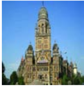
या निर्णयाचा मुंबई महापालिकेच्या ९३ हजार तर

मुंबई महापालिकेचे कर्मचारी, शिक्षक आणि बेस्ट बस कर्मचाऱ्यांना २२ हजार ५०० रुपयांचा दिवाळी बोनस जाहीर करण्यात आला आहे. आरोग्य सेविकांना एक पगार दिवाळी बोनस म्हणून दिला जाईल, अशी माहिती राज्याचे मुख्यमंत्री एकनाथ शिंदे यांनी दिली आहे.