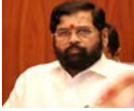
नुकसानग्रस्तांना एकूण साडेचार हजार कोटींचे वाटप सुरू झाले

मुख्यमंत्री एकनाथ शिंदे यांच्या उपस्थितीत आज आपत्ती व्यवस्थापन विभागाची बैठक पार पडली. या बैठकीत अतिवृष्टीने नुकसान झालेल्या ३६ लाख शेतकऱ्यांना मदत देण्याचा निर्णय घेण्यात आला आहे. यानुसार